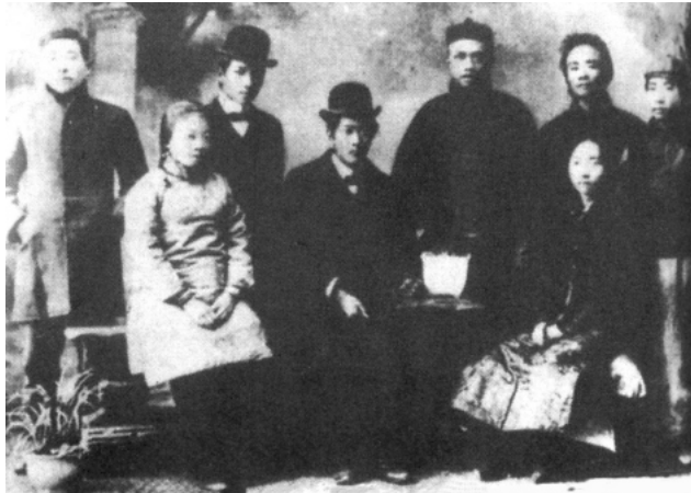
He-Yin Zhen au 1 er rang à gauche

Originaire de la province côtière du Jiangsu, limitrophe de Shanghai, He Ban, née en 1884 et décédée en 1920 à l'âge de 36 ans, va adopter le surnom de Zhen - coup de tonnerre - comme nom de plume, et accoler à son nom patronymique de He, le nom de jeune fille de sa mère, Yin, pour s'appeler He-Yin Zhen, signe de sa volonté de s'émanciper du système patriarcal, fondement de l'asservissement des femmes.